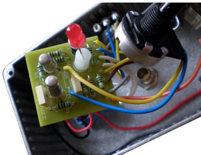
Bild 5. Byter ut R5 mot en potentiometer tillfälligt, för att hitta det värde på R5 där fuzzen funkar bäst.

En sådan här trimpot kan man sätta in även om man kör med kiseltransistorerna BC547. Det är ju inte säkert att fuzzen låter bäst med exakt 6k8, som först föreslås i manualen.