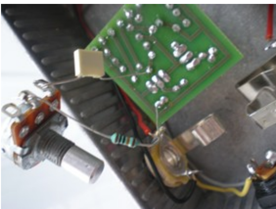
Bild 6. Ett par komponenter mellan två ställen på Moody fuzzen's kretskort, skapar ett riktigt helvetiskt ljud.

Självsvängningar och Extra Sustain. Sätt en kondensator mellan de två ställen på moody fuzzen's kretskort, som framgår av bild 6. Det går bra att fästa komponenten på kortets lödsida. I bilden har vi även satt en 100k resistor och en pot i serie med kondensatorn, för att kunna dämpa svängningarna (de går även att dämpa genom att virda ner fuzz-kontrollen).